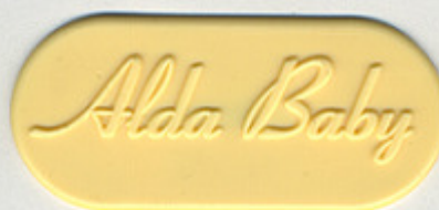
BEIGE PE 3 YW