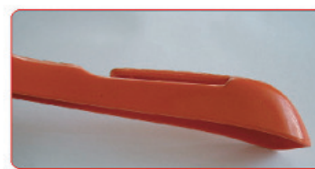
ROSSO ARANCIO (RIF. SEGNATAGLIA) SU BASE POLISTIROLO ABS