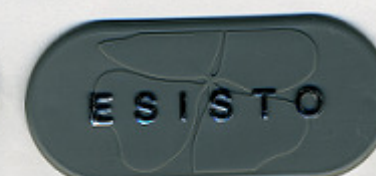
GRIGIO ST/Y 921191