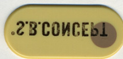
BEIGE RE 8101