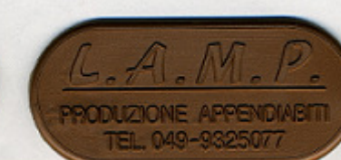
BRONZO PE 8 BR