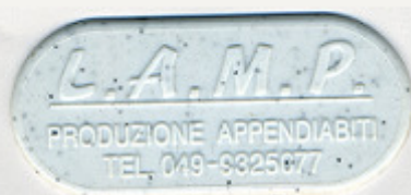
BIANCO MARMO ST/P 1950