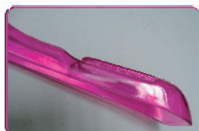
FUXIA TRASPARENTE CRISTALLO (COD. ST/Y 98925)