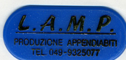
BLU PUNTINATO ST/Y 98666