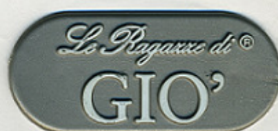
ARGENTO GLITTER ST/Y 043378