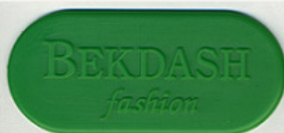
VERDE POLI 37231