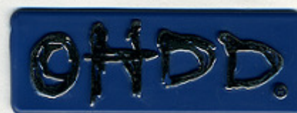
BLU MIX OCEAN STAR+BLU ST/P 6925