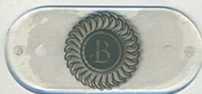
TRASPARENTE IN STIROLUX