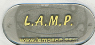
TRASP. FUME' 0,5% 08931