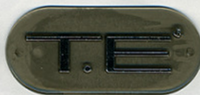
TRASP. FUME' 2% 08931