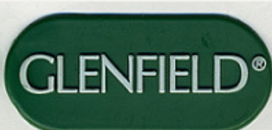
VERDE SCURO ST/Y 72458