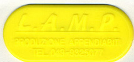
GIALLO CHIARO PE 23 Y