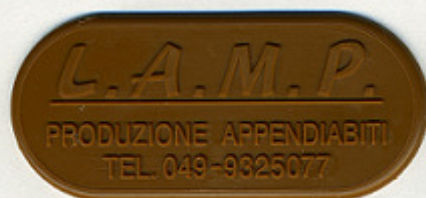
MARRONE (BRUNO RIF. COGNAC) R 800