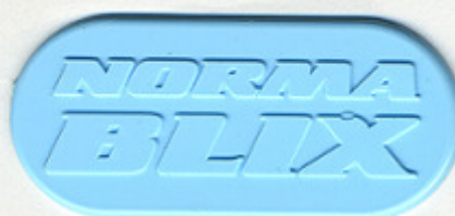
CELESTE RE 665/LAB