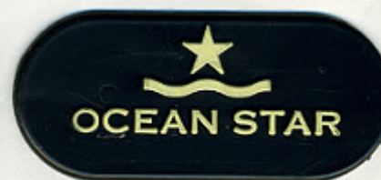
BLU MARINO ST/P 69433