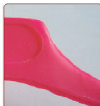
MAGENTA MACRO ROSA FLUID FA 2% (COD. LAB. 0442)