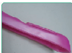
FUXIA PASTELLO COD. ST/Y 98926