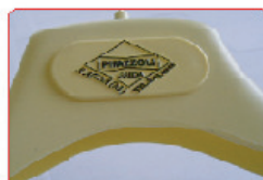
GIALLINO 01 (RIF. SEGNATAGLIA)