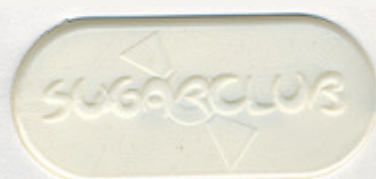
PERLATO ST/P 0440