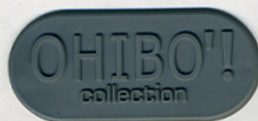
GRIGIO PE 240 WN