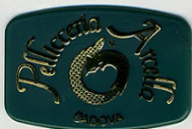
VERDE PS 1178 G