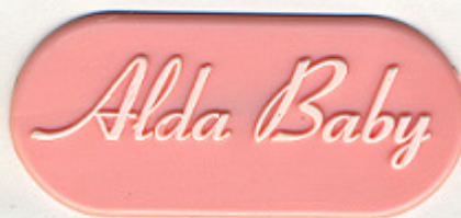
ROSA PE 1 RW