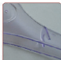
TRASPARENTE GLICINE (CRISTALLO + 1% VIOLA)