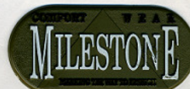
ORO ST/Y 29485