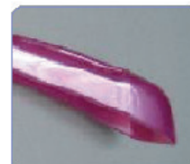
FUXIA PERLATO ST/Y 98925 + PERLATO