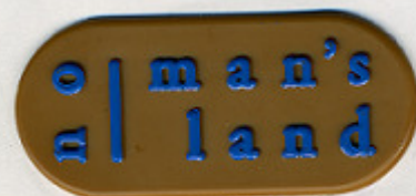
MARRONE ST/Y 89407