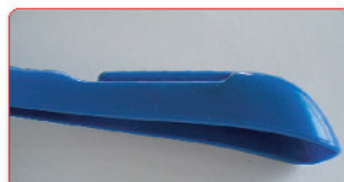
BLU VIVO BL-7 (RIF. SEGNATAGLIA) SU BASE POLISTIROLO ABS