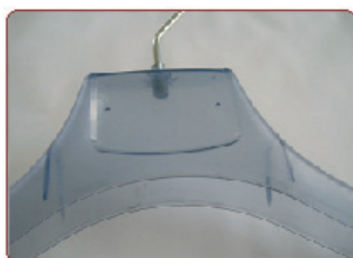
BLU TRASPARENTE (COD. M.C. LAB. 6546)