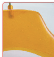
ARANCIO PIINTINATO n° 15