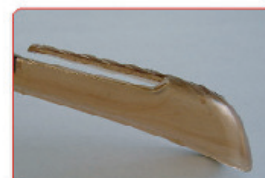
TRASPARENTE MARRONE Cod. ST/Y 98935