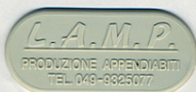
GRIGIO PALLIDO PS 1988WN