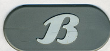
ARGENTO POLI 193 FP