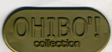
ORO PE 1 AU