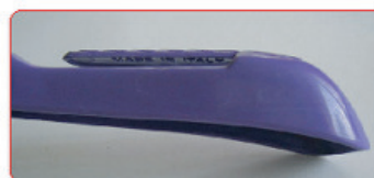
VIOLA (RIF. SEGNATAGLIA) SU BASE POLISTIROLO ABS