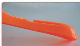
ARANCIO FOSFORESCENTE ENGRAIS NFU42-001 SU BASE POLISTIROLO ABS