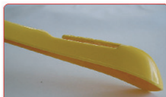
GIALLO OCRA PANT. 142 C SU BASE POLISTIROLO ABS