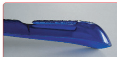
TRASPARENTE BLU 2 CRISTALLO 1 K-RESINA AL 2% (Cod. ST/Y 98265)