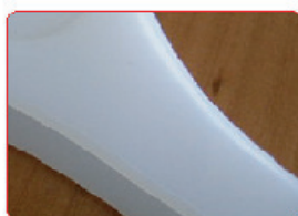
NEUTRO (33% NEUTRO 66% CRISTALLO)