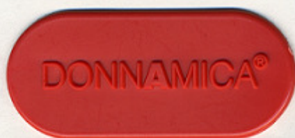
BORDEAUX PE 408 RB