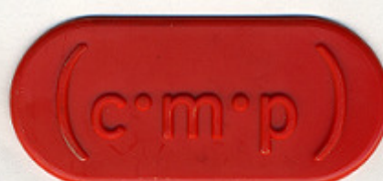
ROSSO ST/P 39176