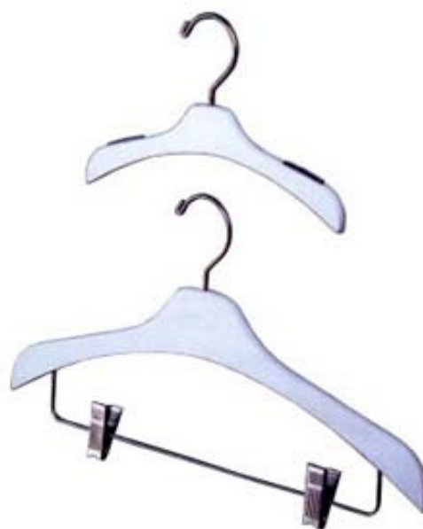
Mod. CAP [senza e con asta con pinze]